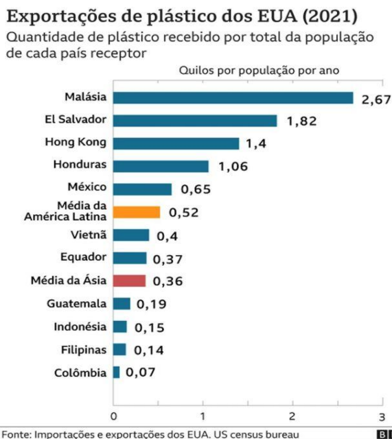
Figura 02 - Gráfico sobre a exportação de plástico dos EUA (2021).

são jogadas fora (vide Gráfico 2). Nesse cenário, o Brasil ocupa a quarta posição no ranking mundial como um dos maiores produtores de lixo plástico, só fica atrás dos Estados Unidos, China e Índia (países com alta produção industrial), sendo a China o país que mais importava resíduos plásticos, porém no ano de 2017 proibiu essa movimentação (WEN et al. , 2021).