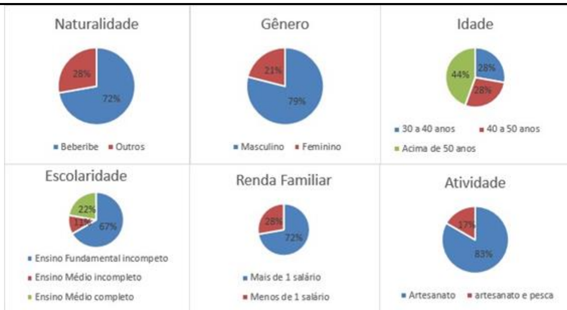
Figura 4 – Perfil Socioeconômico dos artesões de Beberibe.