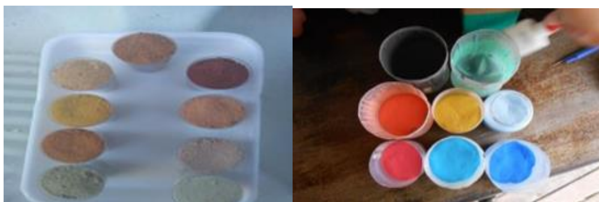
Figura 9 – Solos com cores naturais e artificiais.

Antes com as areias coloridas naturalmente (figura 9), o processo de extração consistia também em buscar as variadas cores disponíveis nas falésias, possível somente com o conhecimento dos moradores, depois de encontrar eram coletadas e armazenadas em sacos em pequenas quantidades, e depois passavam por um processo de peneiração, basicamente eram passadas em peneiras, e depois em uma espécie de pano para retirar o que eles denominam por pó ou para nós a argila da contida na areia. O modo de saber qual areia possui mais argila é pelo tato, sentindo a textura. Atualmente a extração é mais mecanizada e a coloração da areia também se torna artificial.