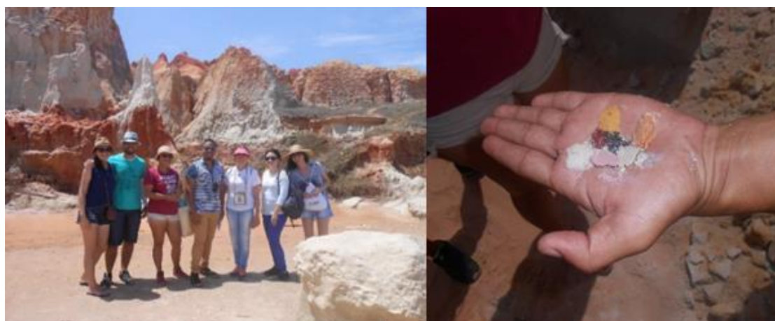
Figura 6 – Turma do laboratório (Lagesolo) e amostras de solos naturais.

De acordo com os dados coletados (figura 6 e 7) , há em torno de 12 cores de solos naturais identificadas no Monumento das Falésias, houvesse essa afirmativa tanto em reportagens de jornal quanto em anúncios turísticos, nas entrevistas realizadas para a pesquisa, os entrevistados, nos contam que há sim, 12 cores identificáveis, porém atualmente há uma grande dificuldade de se encontrar às 12 cores, devido a institucionalização do local, pois algumas das cores eram obtidas através de pequenas escavações, o que hoje é proibido, podendo assim nos apresentar apenas uma pequena amostra de cores que hoje estão dispostas a olho nu.