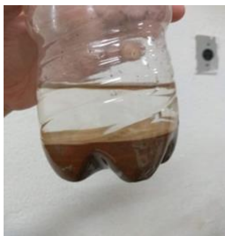
Figura 11 – Processo de separação e análises dos solos.