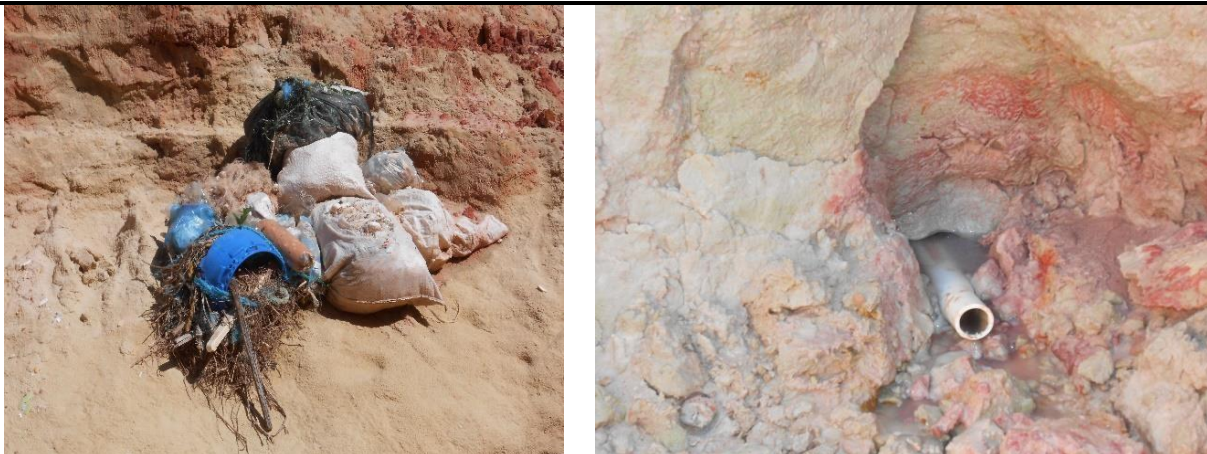
Figuras 5 – Poluição em meio as falésias.

De acordo com os dados coletados (figura 6 e 7) , há em torno de 12 cores de solos naturais identificadas no Monumento das Falésias, houvesse essa afirmativa tanto em reportagens de jornal quanto em anúncios turísticos, nas entrevistas realizadas para a pesquisa, os entrevistados, nos contam que há sim, 12 cores identificáveis, porém atualmente há uma grande dificuldade de se encontrar às 12 cores, devido a institucionalização do local, pois algumas das cores eram obtidas através de pequenas escavações, o que hoje é proibido, podendo assim nos apresentar apenas uma pequena amostra de cores que hoje estão dispostas a olho nu.