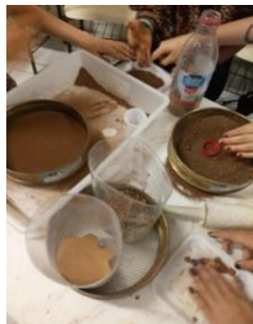
2-Peneiramento do solo