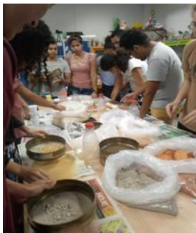
1- Separação do solo

fase utilizamos os equipamentos disponíveis, que foram: vidros de ensaio para a separação dos solos e peneiras manuais niveladas para identificar a granulometria das amostras coletadas. Num processo simples de peneirar separar e analisar as amostras (figura 11). Processo feito antes da pandemia, com poucas amostras da nossa primeira visita, realizada em 2018. Os processos são feitos de forma simples. Nossa análise consiste basicamente na separação das amostras, peneiramento e teste de sedimentação.