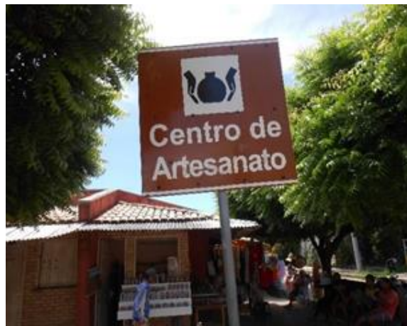
Figura 3 – Centro de Artesanato de Morro Branco.

Ao iniciar conversas e participar ou mesmo apenas observar o cotidiano das pessoas, no nosso caso, os artesãos, buscamos a confiança, o diálogo aberto, para que eles se sentissem à vontade para nos contar o que desejassem, desta forma conseguimos, mais do que respostas para nossos questionários, conseguimos ouvir suas indagações, preocupações, problemas sociais, troca de saberes, que também é importante para nossa pesquisa.