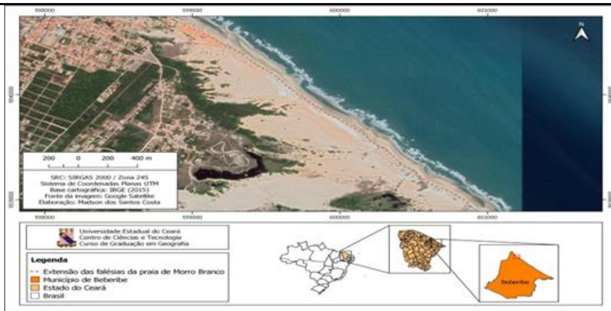
Figura 1 - Mapa de localização do monumento das falésias. Fonte: Elaborado por Madson dos Santos Costa.

Atualmente o responsável pela gestão do Monumento das falésias de Morro Branco é a Secretaria do Meio Ambiente (SEMA), que tem por dever gerir, orientar e proteger. Para Queiroz e Quintanilha (2020) as unidades de conservação se caracterizam como espaços naturais onde as práticas de educação ambiental são possíveis e apresentam diversas ações transformadoras. Ao estudar unidades de conservação (UC), entende-se que há a necessidade de haver projetos ligados à educação ambiental, já que a implementação das UC's, implica em uma gestão que desenvolva ações de preservação e conscientização. Silva (2008) também salienta que muitas UC's foram criadas devido ao desenvolvimento do turismo que ocorre nas áreas. Mas nem sempre as áreas estão preparadas para receber um grande fluxo de visitantes. A falta de planejamento ambiental compromete a capacidade de suporte dessas áreas protegidas. Desde a implantação da Unidade de Conservação, segundo relatos dos moradores, foram realizadas reuniões explicativas sobre as novas regras de utilização do local, e também sobre a proibição da retirada dos solos, como solução, para o trabalho dos artesãos, uma nova área foi escolhida para a retirada da matéria prima de seus artesanatos.