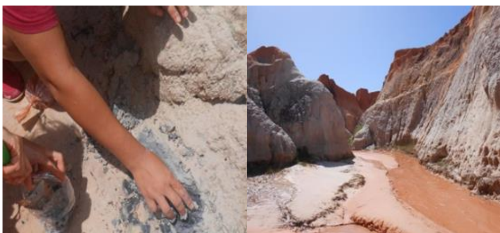
Figura 10 – Contraste de cores na falésia.

Com relação a outras cores Morais et al. (1975), mostram que as falésias de Morro Branco apresentam quatro camadas com características texturais e estruturais próprias. A camada inferior corresponde a um arenito friável, amarelo-esverdeado, com cimento argiloso. A segunda camada apresenta cores variadas, textura mosqueada. São sedimentos mal selecionados de grande variedade faciológica. A terceira camada é um arenito de coloração cinza esbranquiçada com boa porcentagem de argila e silte sem estratificação e com de grânulos esparsos. A quarta camada (superficial) é constituída de areias argilosas, de coloração avermelhada ou amarelada.