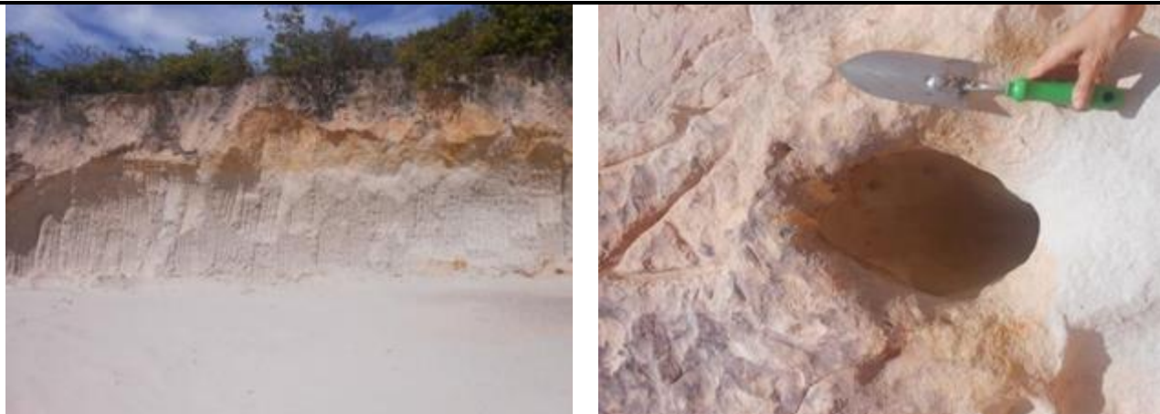
Figura 8 – Local de retiradas de solos.

A imagem acima mostra o atual local onde é retirado o solo para a produção artesanal, nota-se que é basicamente um solo neutro, branco que serve de base para pigmentar artificialmente. E na imagem 2 uma antiga veia de extração solo no monumento das falésias.