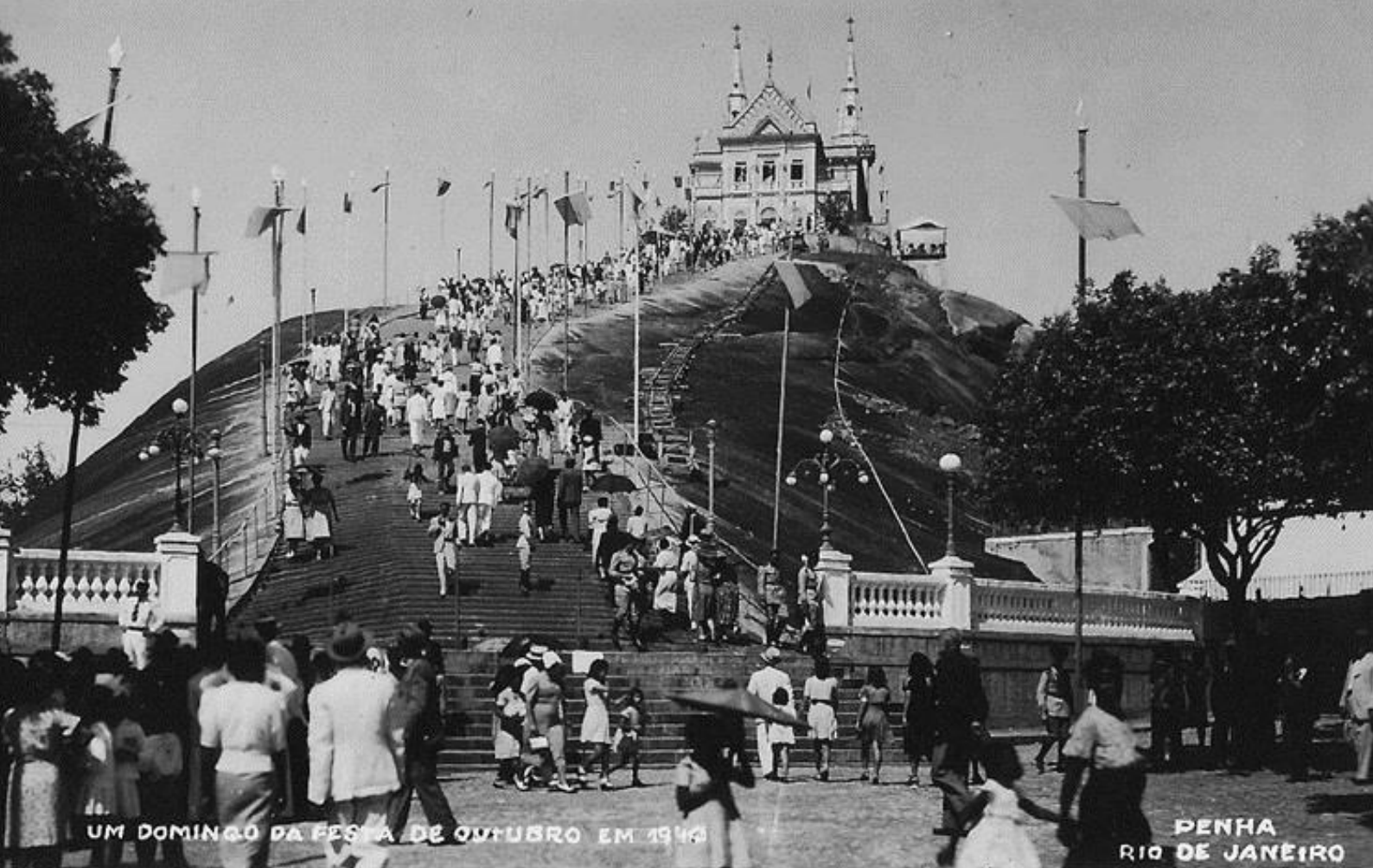
[Fig. 3] Festa da Igreja da Penha em 1942.

As histórias que remetem à Penha foram registradas nas músicas, que entrelaçam relatos cotidianos à devoção à padroeira da Igreja. Vale citar algumas das músicas que fazem alusão à região da Penha e suas histórias. Noel Rosa (1910-1937), por exemplo, reconhecido por seu pertencimento ao bairro de Vila Isabel e enaltecendo-a em quatro sambas, chegou a ter oito composições remetendo-se à Penha. O samba “Festa da Penha” foi composto por Cartola (1908-1980) e Asobert, trazendo a história de um homem que pega um terno emprestado para ir à festa e promete não subir a escada de joelhos para não estragar a roupa. João Bosco (1946) e Aldir Blanc (1946-2020) compuseram “Escadas da Penha” (1975) que narra uma tragédia passional na Penha, de um homem que descobre que sua mulher negra o trai com o amigo. No “Baião da Penha”, no trecho acima, gravado inicialmente por Luiz Gonzaga (1912-1989), mostra a devoção do nordestino indo pedir proteção e paz para o lar do retirante na cidade grande. Ou ainda a repressão dos festejos citada do trecho de “Viva a Penha” interpretada por Pedro Celestino em 1928.