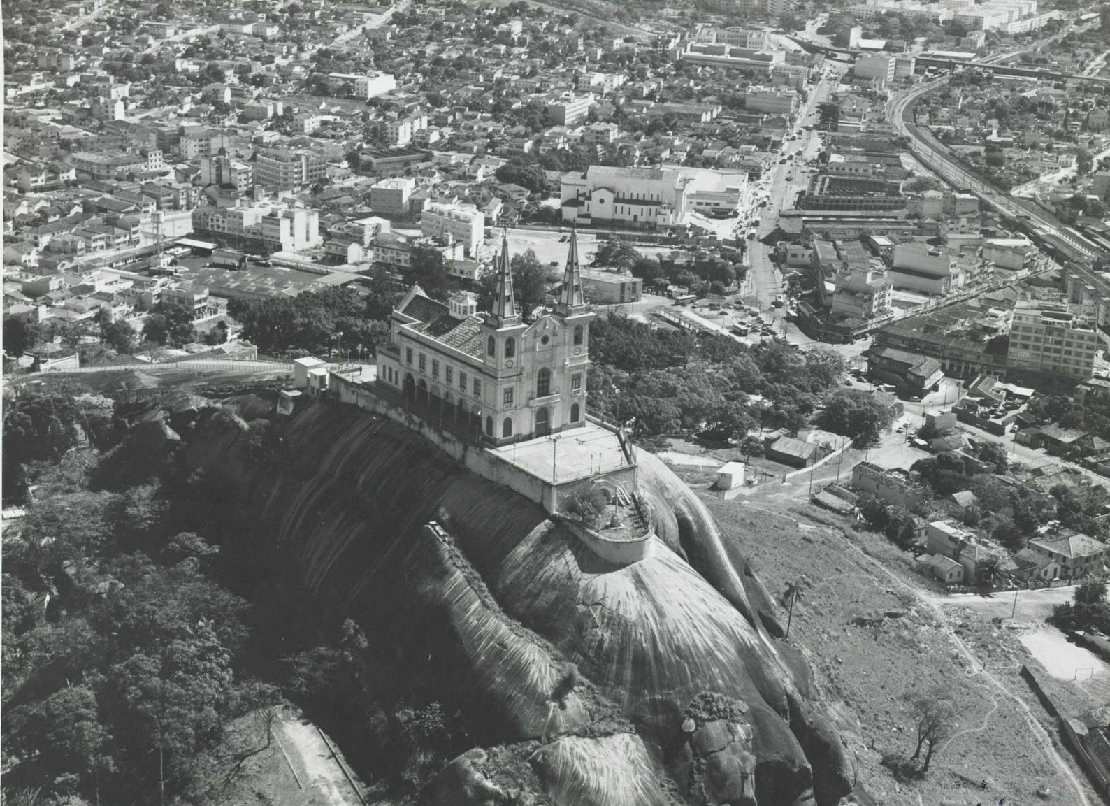
[Fig. 1] Igreja da Penha. Fonte: BN Digital. Disponível em: http://objdigital.bn.br/objdigital2/acervo_digital/div_iconografia/icon988882/icon988882.jpg Acessado em: 12/11/2020

A antiga freguesia de Nossa Senhora da Apresentação de Irajá, do final do século XVII, passou por divisões e uma de suas partes deu origem à Penha. A freguesia de Irajá uniu-se à de Inhaúma e consolidaram-se como uma importante região de produção de açúcar para os engenhos das proximidades, além de produtos de subsistência para a população que ia crescendo no entorno. No século XIX a região abrigou a produção cafeeira. Há indícios de que ao final deste século, a localidade possuía uma suburbanização, vinda do crescimento desordenado ao redor da Estrada de Ferro Central do Brasil.