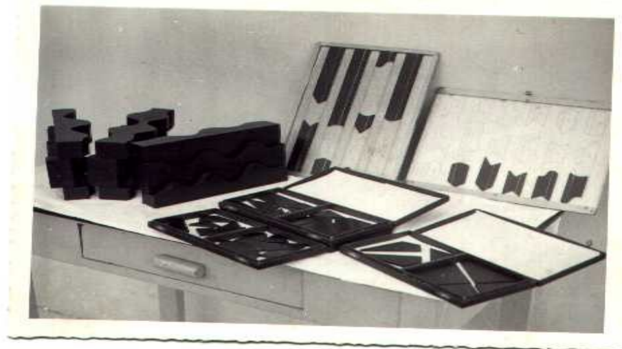
Figura 1: Equipamentos.

Ressalte-se, ainda, os seguintes aparelhos: sinuosidade de Bonnardel, mecanismos de Fritz-Heider, esfignomamômetro, aparelho de Richter, plastoscópio, dinamógrafo e aparelho de Bedini.