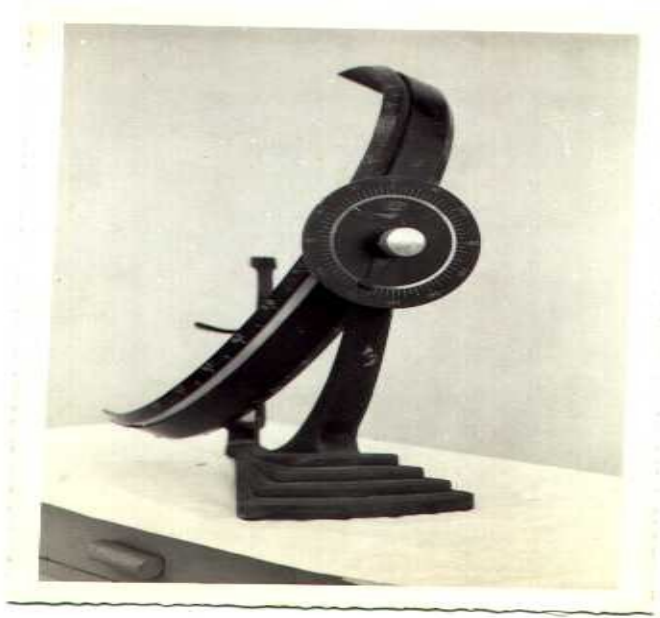
Figura 2: Equipamentos.